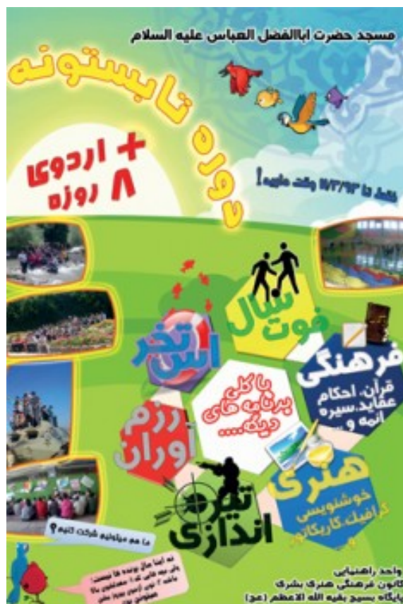
نمونه کامل شده