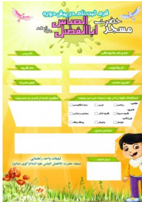
نمونه کامل شده نمونه فرم ثبت نام در دوره